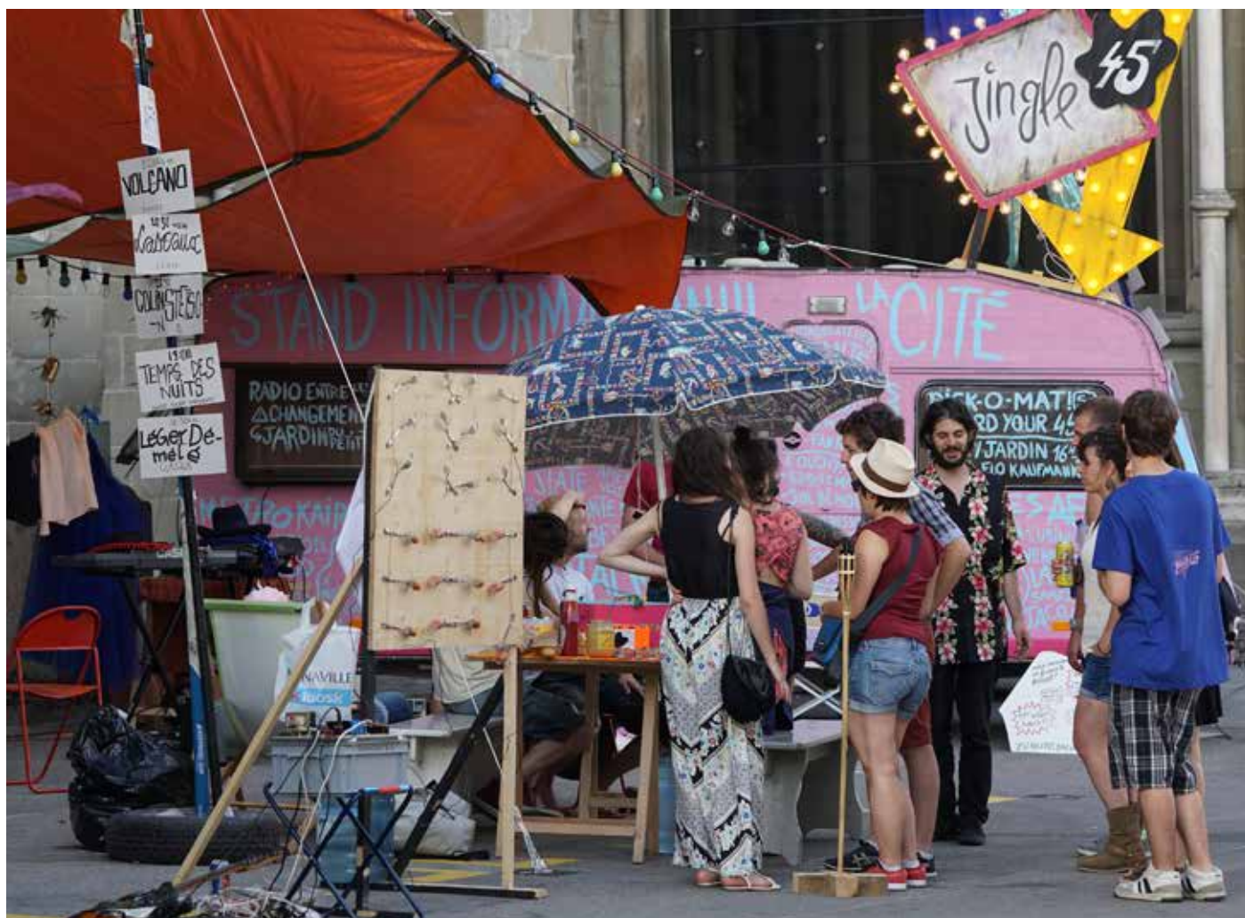
Jingle 45, Festival de la Cité, Esplanade de la Cathédrale, juillet 2016