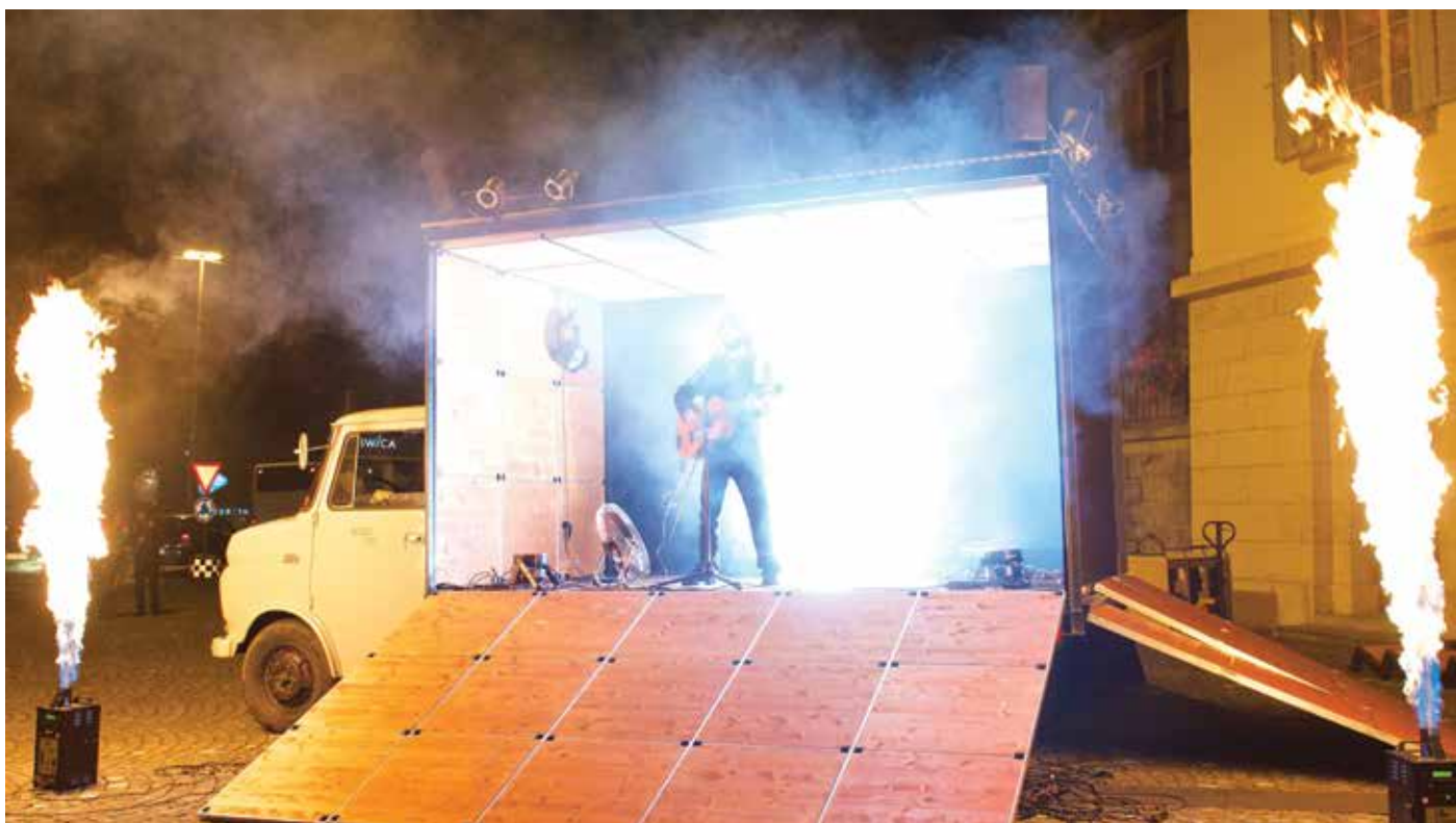
Scratched à l'inauguration de l'adapter, Arrau 2014