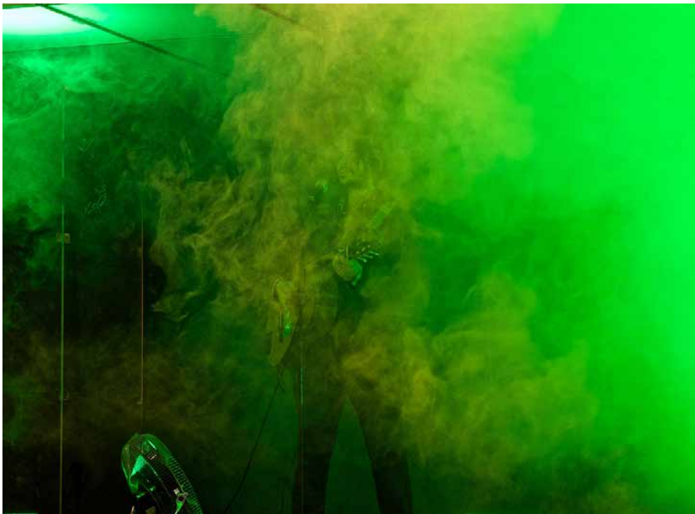
Scratched record, 2014 in Araau