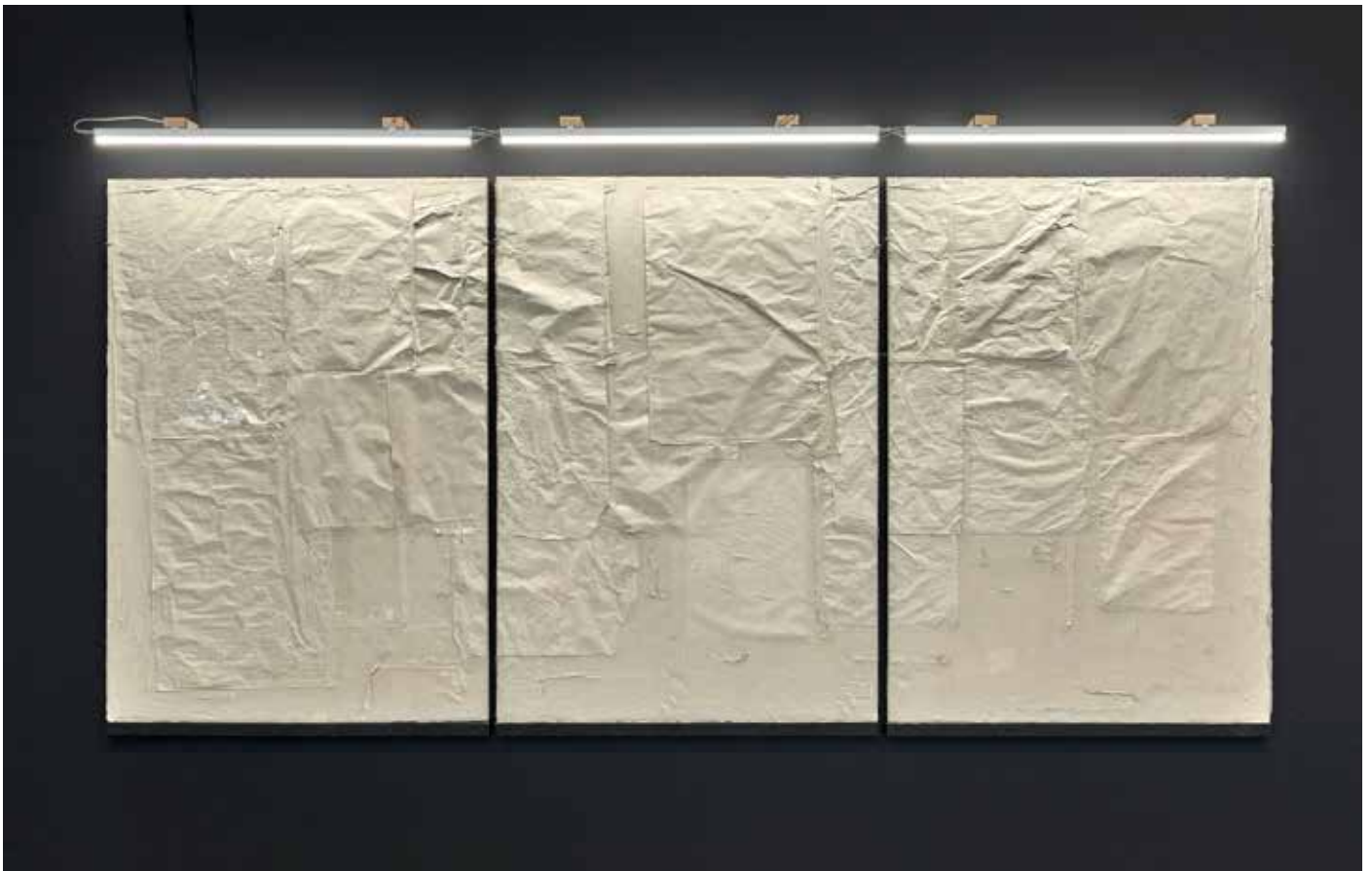
Moulage d'un panneau d'affichage