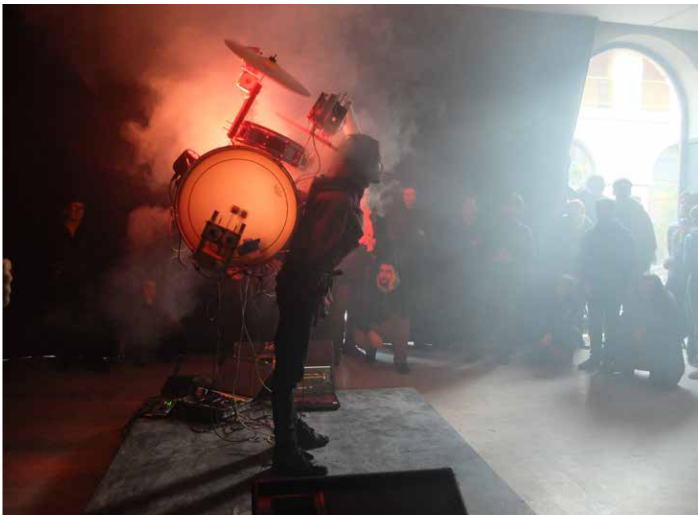
Chaosphonies à l'espace Halle Nord