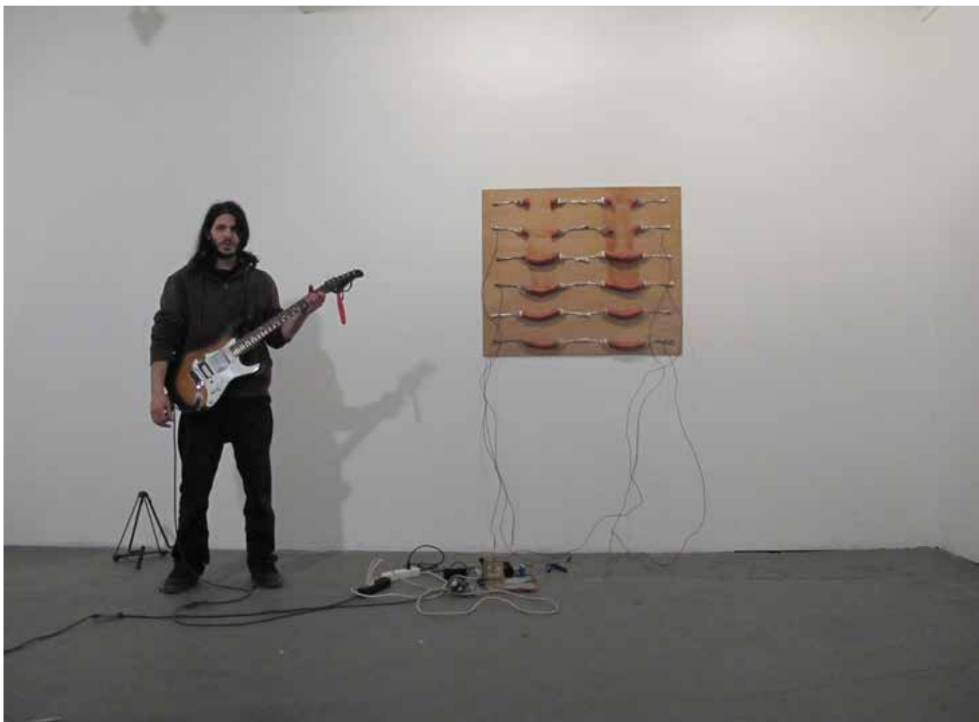
Frankenstein espace cheminée nord