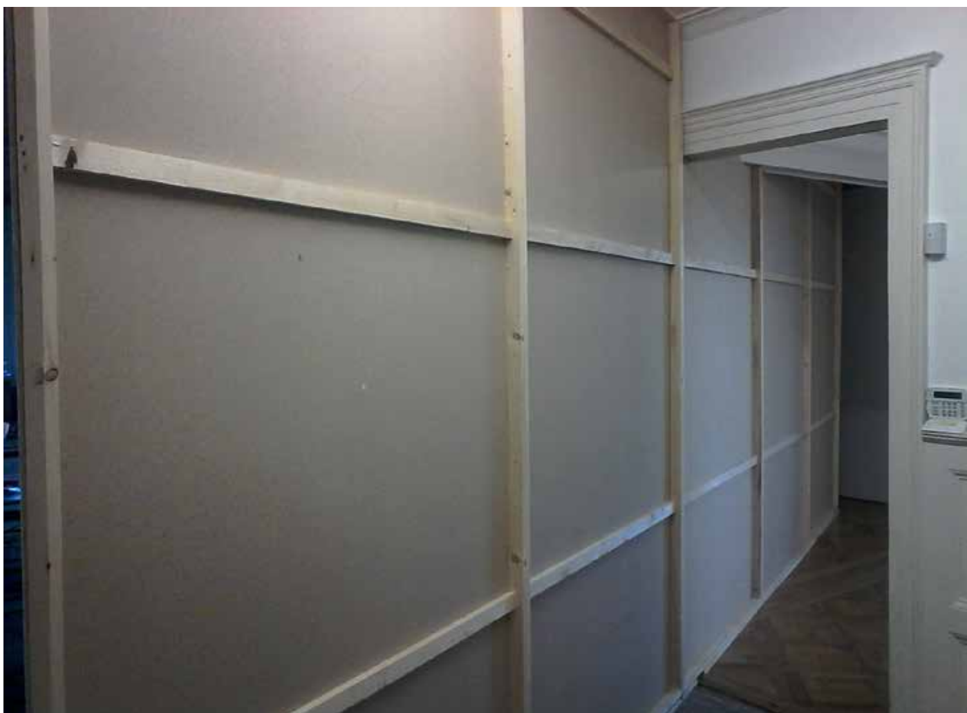
1er étage de l'exposition, réalisé à la Villa Bernasconi, Genève