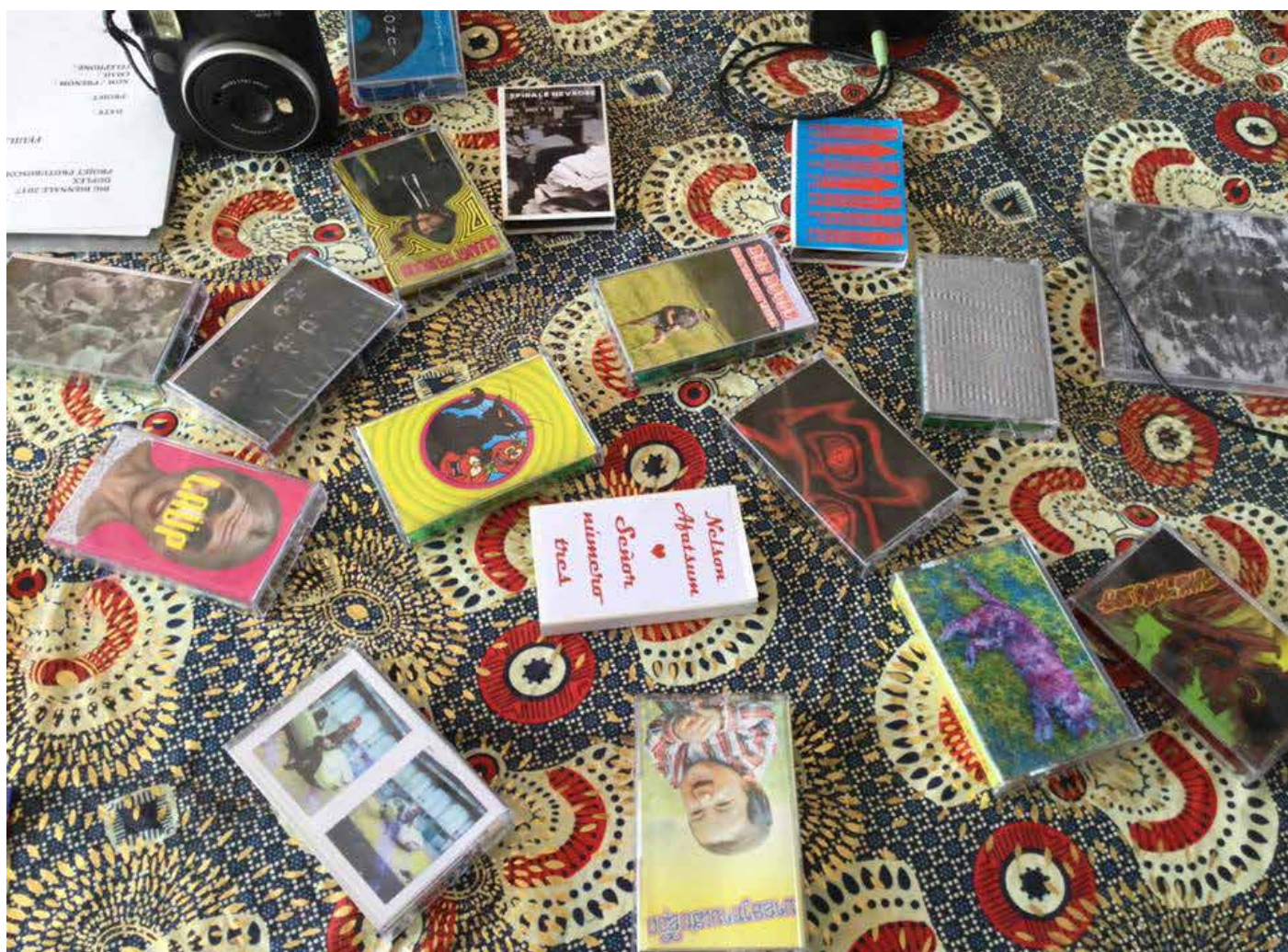
Protuboscope , sélection de K7 éditées dans le cadre de BIG plaine de Plainpalais, Genève