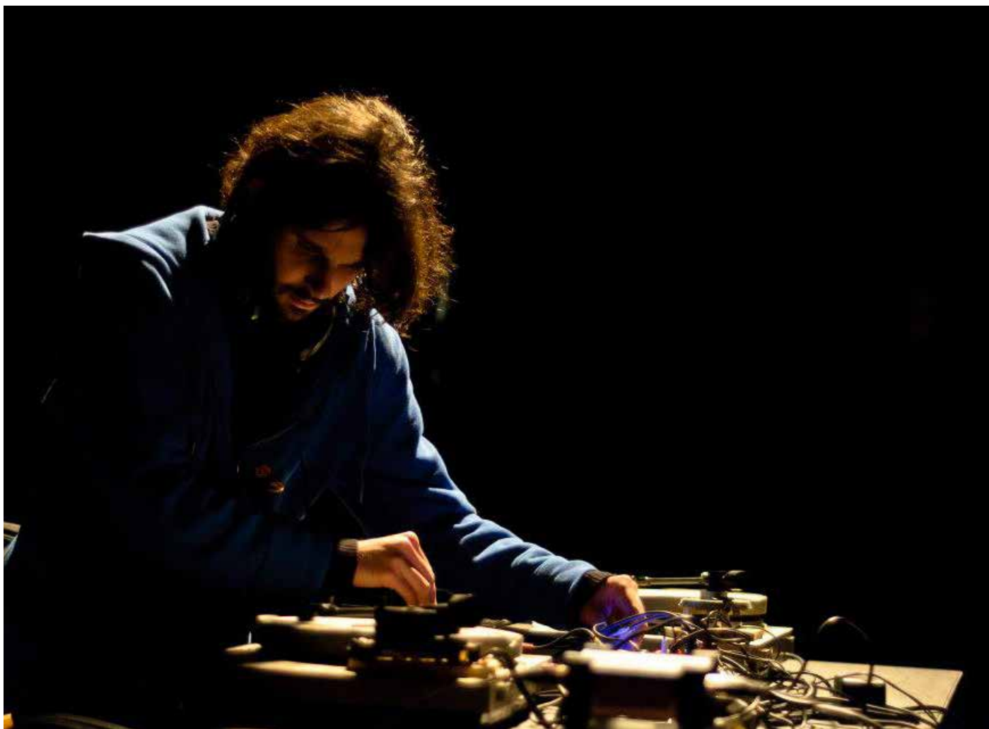
Concrete Music festival face H