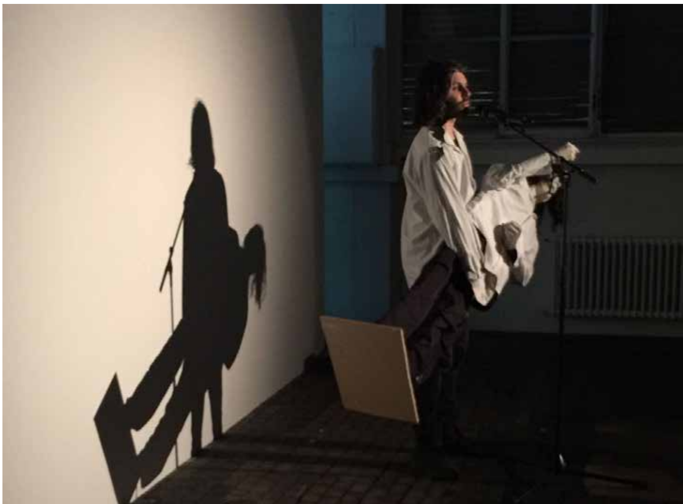
Histoire d'un enregistrement , dans le cadre du programme Slightly slipping on a banana skin, à l'occasion de la Nuit des musées 2017. Curatrices Bénédicte le Pimpec et Isaline Vuille