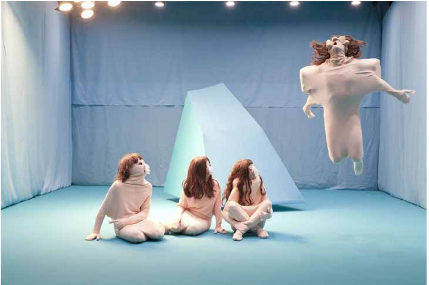
L'Impression , Théâtre de l'Usine, Genève