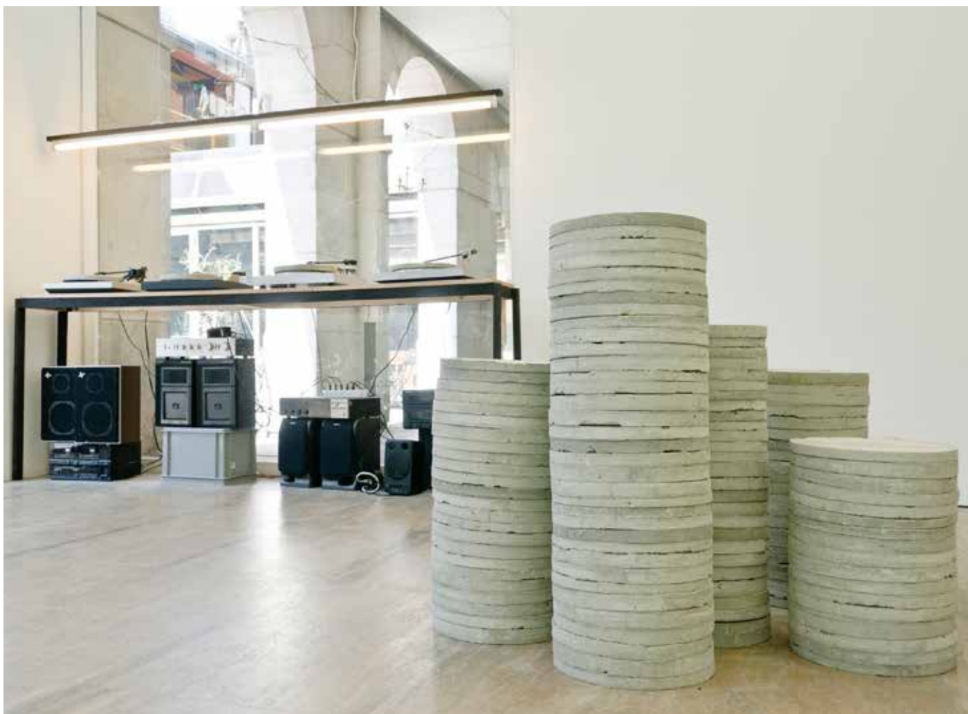
Installation Concrete Music , espace Halle Nord (2012)